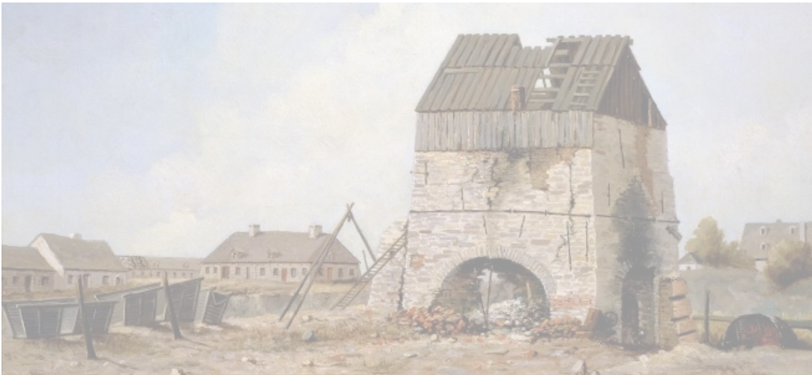
Les forges du Saint-Maurice vers 1850, Henry, R.S. Bunnett (1886).

Barrage de la Shawinigan Water and Power Co., Shawinigan Falls (QC), en 1917 (© Musée McCord - William Notman & Sons, photo no. 77678) http://collections.musee-mccord.qc.ca/en/collection/artifacts/VIEW-17248